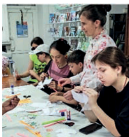
Изготовление символа праздника