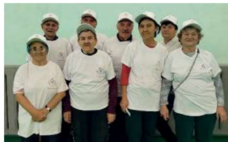
Участники спартакиады Ключевской районной организации АКО ВОИ

Нашим обществом инвалидов сформировано две команды от первичных организаций сельских поселений: Васильчуки, Целинный, Северка, Петухи. Всего около 70-ти участников соревновались в шести спортивных дисциплинах, демонстрируя ловкость, меткость, быстроту и эрудицию. В программу вошли следующие виды соревнований: дартс, шашки, корнхол, биатлон и эстафета «Ловкая команда». Хочу рассказать про соревнования по корнхолу. Эта спортивная игра стала одной из самых любимых среди членов нашей организации с того времени, когда мы участвовали в проекте Алтайской краевой организации Общероссийской общественной органи-