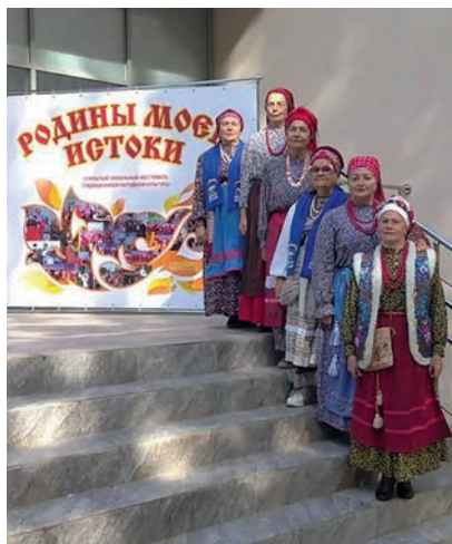
Фольклорный коллектив «Былина»

20 сентября 2025 года в городе Заринске проходил третий открытый зональный фестиваль народной традиционной культуры «Родины моей истоки».