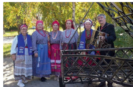
Фольклорный коллектив «Былина»

Новоалтайская городская организация инва-