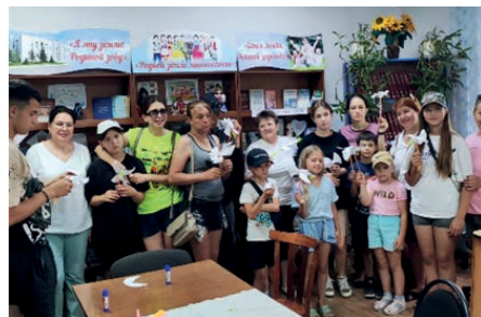
Общее фото в музее

Вторая часть мероприятия прошла в спорткомплексе села Гальбштадт, где семейные команды с детьми-инвалидами соревновались в конкурсах и эстафетах под девизом: «Делай с нами, делай как мы, делай лучше нас». В ходе соревнований команды померились силой, проявили смекалку и ловкость в веселых эстафетах. Командам были предложены занимательные конкурсы с бегом,