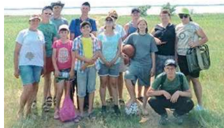
На озере Щекулдук

Мы открыли для себя еще один активный способ установления контакта с окружающим миром и природой – туристические походы. Этим ле-