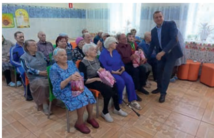
Вручение памятных подарков

Алтайским районным обществом инвалидов создана первичная ячейка в доме-интернате малой вместимости района. В честь месячника пожилого человека артисты Алтайского культурно-досугового центра подарили инвалидам и пожилым людям, проживающим здесь, незабываемый торжественный концерт.