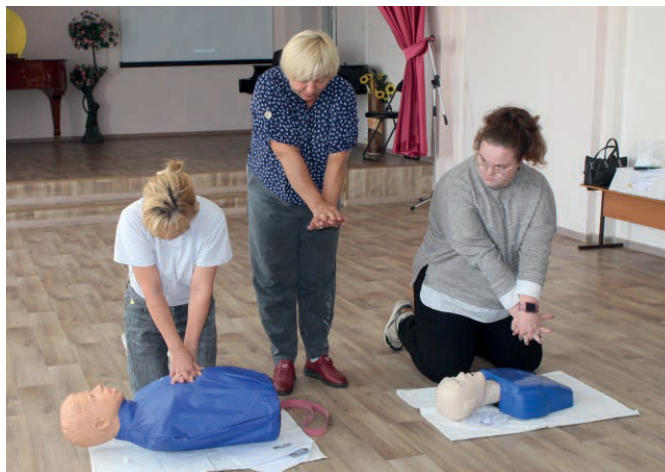
Занятия по ГОС