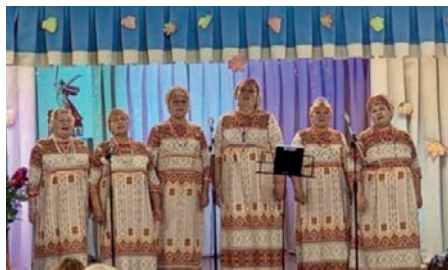
Участники концертной программы

Месячник пожилого человека в Бийской местной организации АКО ВОИ начался с кустового мероприятия «Ваш возраст золотой».