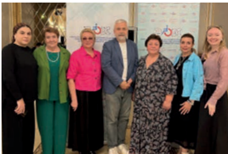
Участники Школы актива ВОИ

Делегация Алтайского края приняла участие в Школе актива Всероссийского общества инвалидов «Шаг навстречу – 2025».