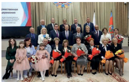
Торжественная церемония награждения

По информации администрации Алтайского района