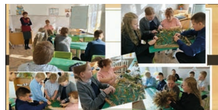
Завьяловская МО ВОИ

В организациях устраивают акции «За мирное небо!» в поддержку СВО. Проводят благотворительные ярмарки изделий декоративно-прикладного творчест-