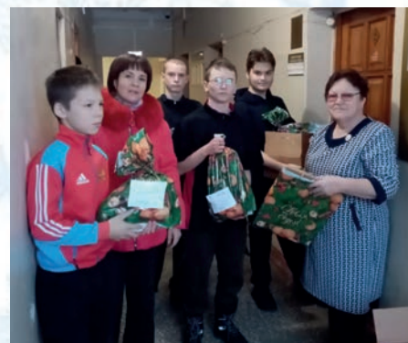
Волонтерский отряд помогает Алтайской МО ВОИ