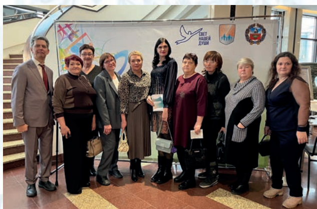
Делегация АКО ВОИ