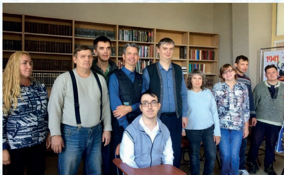
Участники студии «СтихиЯ»