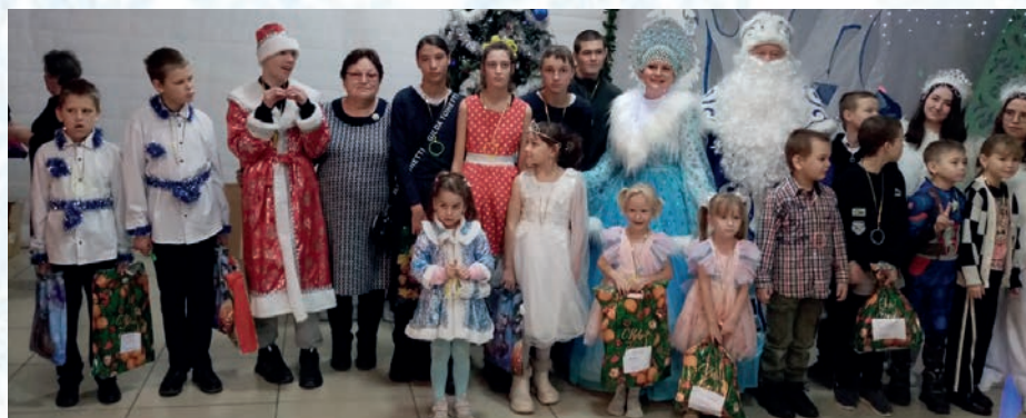
Алтайская МО ВОИ