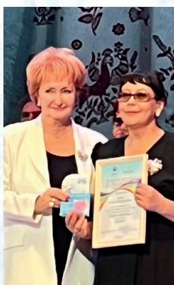
Награждение в номинации «Подийум»