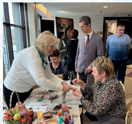
Мастер-класс декоративно-прикладного творчества