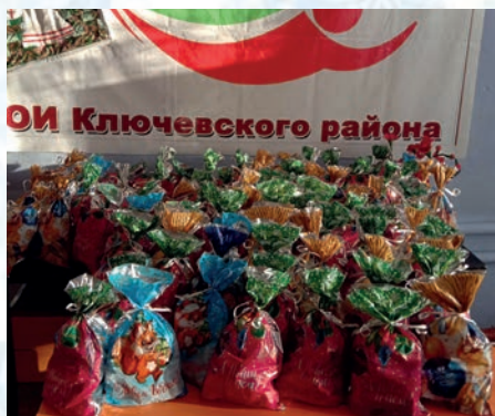
Подарки от Ключевской РОО АКО ВОИ

По информации АКО ВОИ