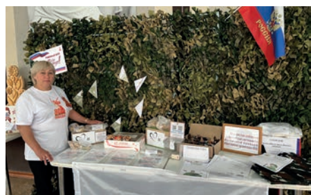
Ключевское районное общество инвалидов