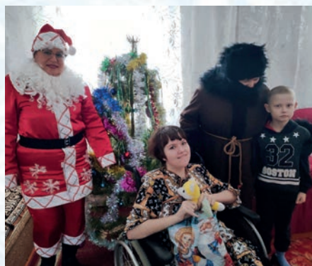
Поздравление от Немецкой национальной МО ВОИ