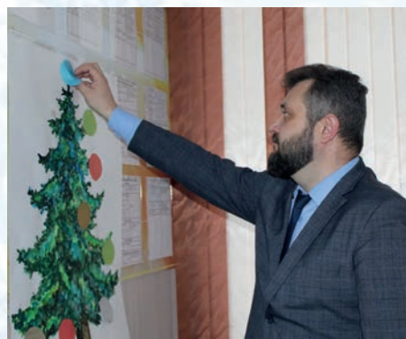
Глава Ключевского р-на участвует в акции «Добрый подарок»