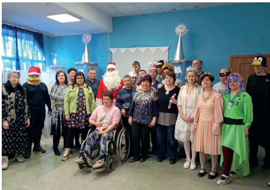
Праздник в Барнаульской МО ВОИ

праздник, укрепить веру в сказку! Будут проведены и утренники в период с 20-го по 26-е декабря 2025 года.